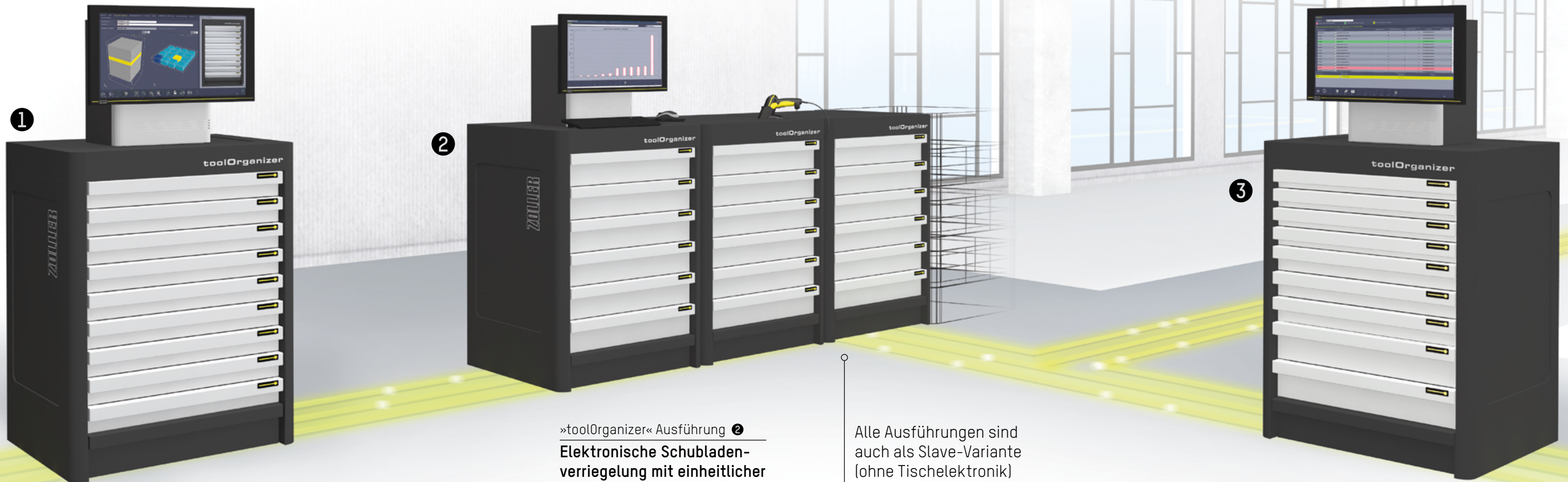
»toolOrganizer« Ausführung ① Mechanische oder elektronische Schubladenverriegelung mit einheitlicher Fachbodenhöhe

Mit diesen Smart Cabinets machen Sie alles richtig.